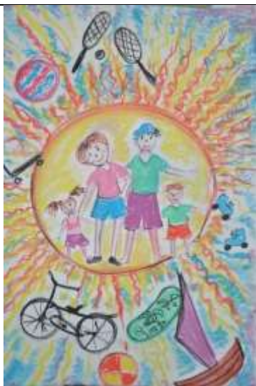
"Спортивное лето!", Ваня Барабанов